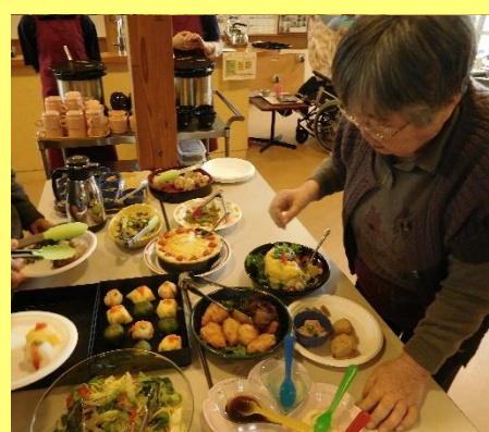
好評のバイキング会食